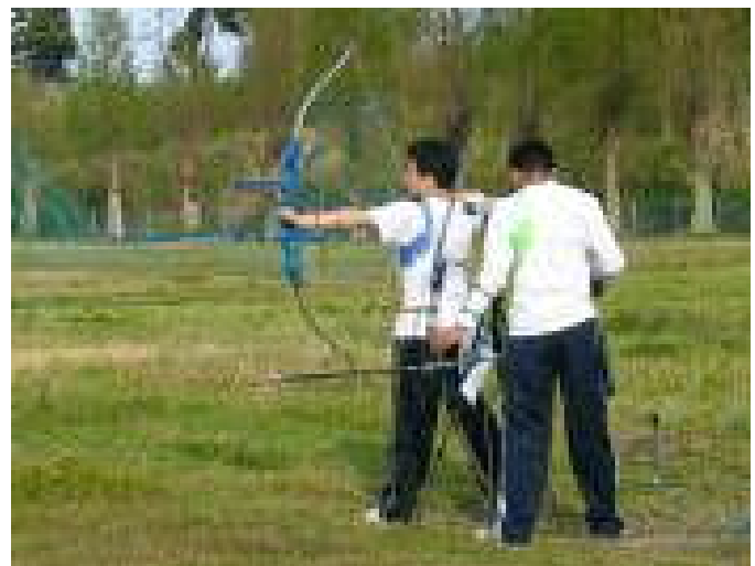
インターハイを目指して練習に励む。アーチェリー部に